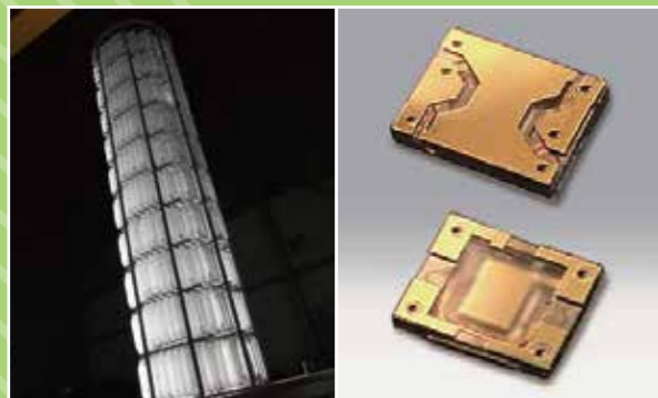
育成炉から引き揚げられた人工水晶 次世代水晶タイミングデバイス