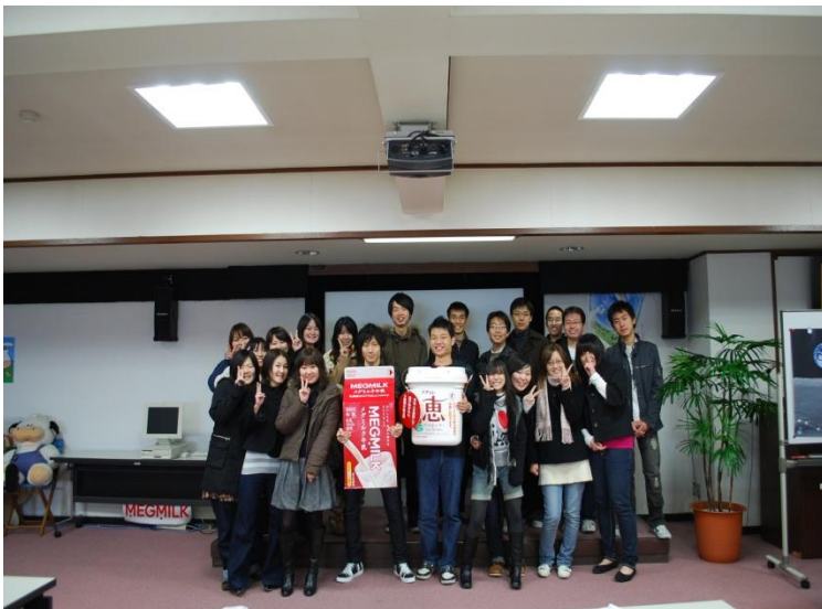
こんなに来てくれました!!!!

午前中にメグミルク工場を訪れました。案内人の方は、面白い人で笑いを取り入れつつ、「すごい！」と思わせてくれる場面もあり、牛乳だけでなく、ヨーグルトやチーズ等の乳製品の他、アイスクリームも生産しています。ちなみに、「MEGMILK」「毎日骨太」「ナチュレ恵」といった製品を販売しています。（日本ミルクコミュニティ神戸工場 http://www.megmilk.com/factory/kobe.html ）