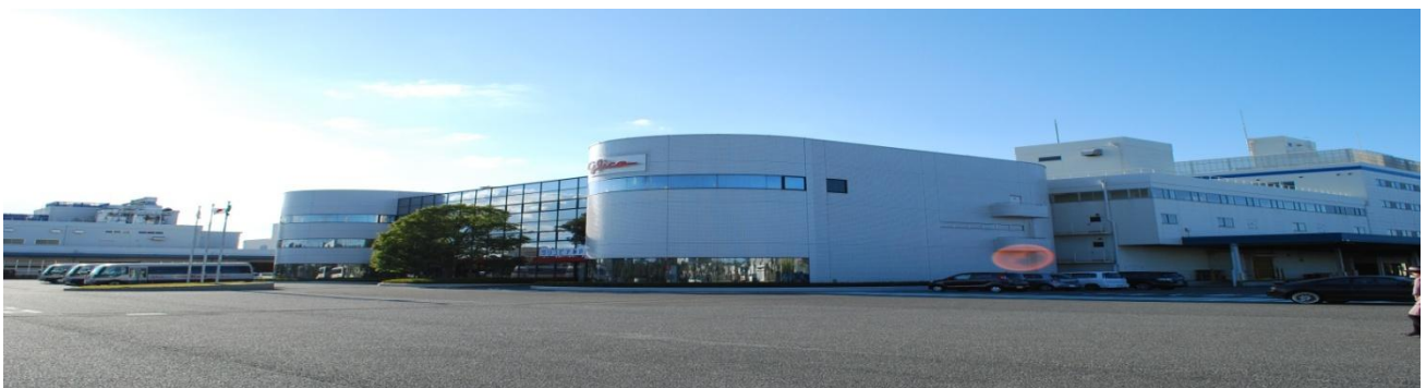
グリコピア神戸って広いなー!!!

昼食後、バスで5分から10分くらい移動したところにグリコピア神戸がありました。綺麗なガイドさんが工場内を丁寧に案内して下さり、オープンでポッキーを焼くところや箱詰めからすべて機械で行われ、チェックをするところは人間によって行われていました。「グリコ」「ポッキー」「プリッツ」といった製品を販売しています。（グリコピア神戸工場 http://www.glico.co.jp/glicopia_kobe/ ）