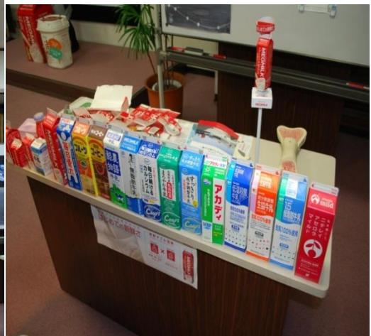
これ飲んだことがあるぞ！