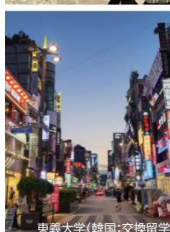
東義大学 (韓国:交換留学)