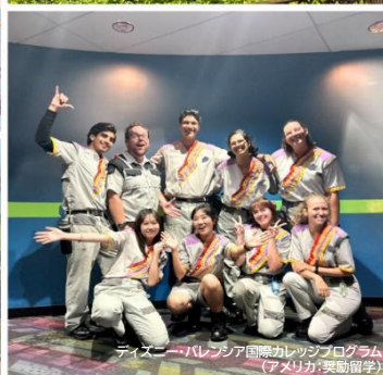
ティスレー・パレンシア国際研修プログラム (アメリカ:奨励留学)