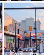
カーボット大学 (カナダ:交換留学)