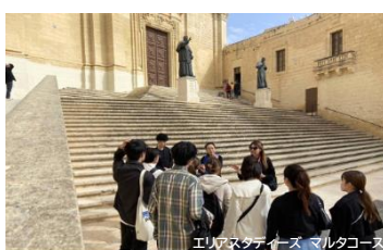
エリアスタディーズ マルタコース