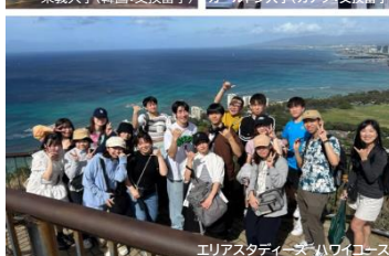
エリアスタディーズ ハワイコース