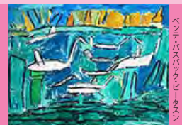
ベント・ハヴン「ペーサー」