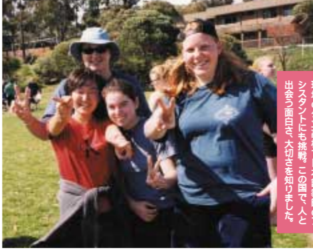
現地の公立高校で日本語教師のアシスタントにも挑戦。この国で、人と出会う面白さ、大切さを知りました。

自分らしく生きるため、ボランティアの自発的な行動方法を知って欲しい。ボランティアという言葉には、どうしても無償の奉仕というイメージが強い。だから、多くの学生は、頭から、自分とは関係のないものと感じてしまっています。ですが、実は、その語源となっている「ボランティア」という言葉、これは、自由意志」という意味なんです。つまり、ボランティアとは、自由な意志に基づいて自ら進んで行動を起こすこと。国や企業の枠組みではできないことを、例えば、NPO、NGOといった組織や活動を通じて、「自発的に実現していく」というあり方そのものなのです。私が学生に、ボランティアに目を向けて欲しいと考えているのは、まさにその点。 いまは、インターネットの普及などにより、社会が自発的に動きやすい構造となってきました。やりたいことを実現する枠組みは、企業に入るか、公務員になるかだけではありません。自分から行動を起こす可能性も視野に入れると、より自分らしい生き方が選べるでしょう。いま、ボランティアを学び、実践することは、そうした生き方を発想するうえで、非常に有効な手段なのです。