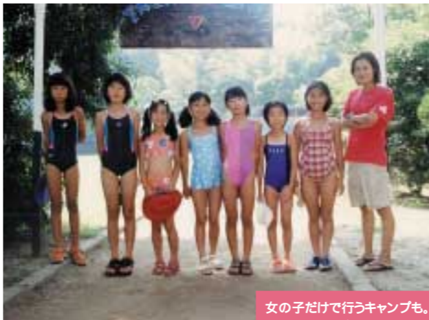
女の子だけで行うキャンプも。普段は、男の子が担当している作業もこなさなければならぬので大変ですが、かなり盛り上がります。