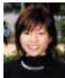
仏校2級の実力を発揮できる株 堀場製作所に今年4月から勤務予定。