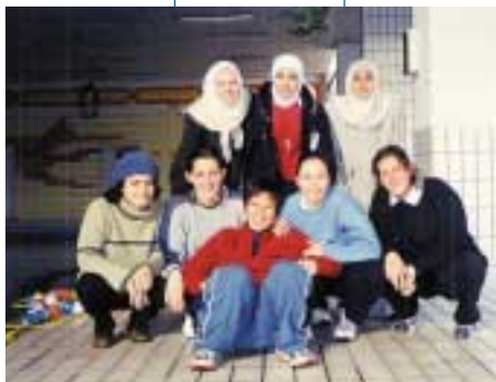
仲良くなったクラスの生徒たちと、プールのそばで。休みの日はよく一緒にご飯を食べに行きましたが、なぜかいつもイタリアンでした。