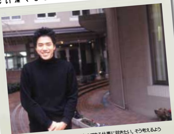
将来は、子どもをさせることのできる仕事に就きたい。そう考えるようになったのも、ここで過ごすようになってから。

役員をしていたのがきっかけで、「レインボーハウス」建設の募金に携わり、その縁で、「レ」が竣工してからボランティアとしてお手伝いをしてきました。活動を通して感じるのとは、とにかく子どもたちの心の傷の深さ。普段は元気に遊んでいるのに、小さな揺れを感じただけで、いまでも涙を流す子がいるし、中学生にもなるのに明かりを消して眠れない子がいる。けれど、僕も父親を病気で亡くしているのだから、なんとなく共感できるのですが、彼らが求めているのは、その場限りの優しい言葉やモノじゃない。だから僕は、できるだけ多くの時間を彼らと共有することになっているんです。 そして、彼らを理解しようとする過程、仲間と意見をぶつけ合ってきた体験は、僕自身をすごく成長させたとも思う。もし、「レ」になければ、僕は一人で、もっと要領よく生きていけたかも知れないけれど、いまは不器用でも人と分かち合っていて生きる楽しさを知りました。そんな自分を、前より少し誇らしく感じます。