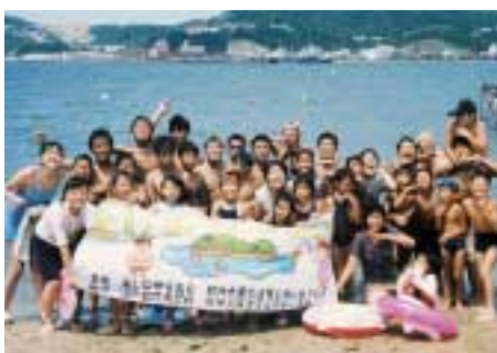
1999年にYMCAの施設を借りて行った「余島の集い」。遺児たちと初めて触れあい、本音を聞いた、忘れられない体験。

こんなふうに話すとき、ただ、自分の時間を無駄にしていると思われるかも知れませんが、それは誤解です。