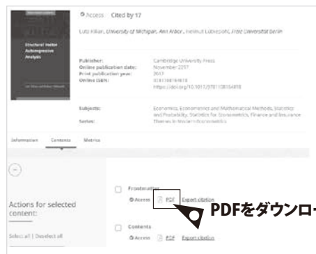
画面例: Cambridge University Press

章ごとにPDFをダウンロードする電子書籍もあります。学外からアクセスするときは、VPN接続を利用してください。