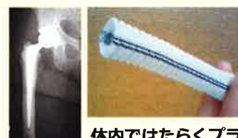
体内ではたらくプラスチック