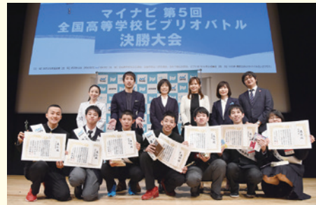
今年1月の決勝大会表彰式の様子

【日程】2020年1月26日(日) 【会場】よみうり大手町ホール(東京都千代田区大手町) 【主催】活字文化推進会議 【主管】読売新聞社 【後援(予定)】全国高等学校文化連盟、全国学校図書館協議会、日本書籍出版協会、ビブリアバトル普及委員会