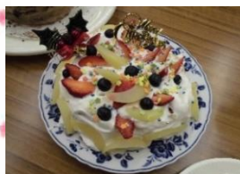
クリスマスケーキ コレクション