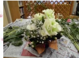
フラワーアレンジメント