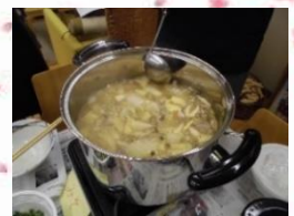
『イモ煮』を作りまし