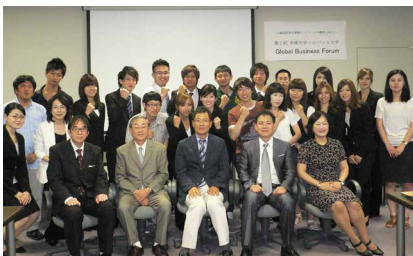
2010年7月 第2回グローバルビジネスフォーラム (甲南大学・韓国ハンバット大学)

グローバル社会に適応すべく、2010年3月にはBI研究所と韓国国立ハンバット大学インキュベーション・センターと、そして、2013年7月には台湾国立聯合大学管理学院と学術・研究交流に関する協定を締結し、国際研究交流を進めています。これらの協定のもと、互いに研究員が行き来し、グローバル・シンポジウムを開催したり、共同調査を実施し、成果を公開しています。今後、国際的な産官学連携研究の推進をはかり、その活動をさらに東アジアへ拡げて行くべく、活性化をはかっています。