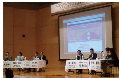
2014年7月 10周年グローバルシンポジウム (甲南大学・台湾国立聯合大学・台湾東海大学)