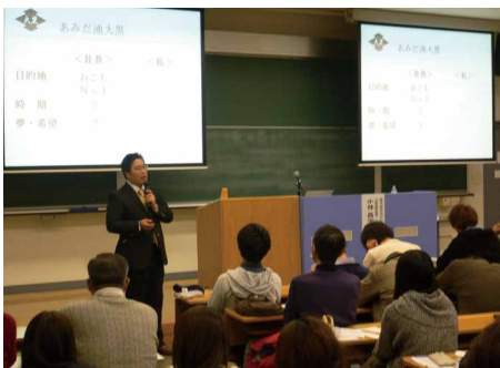
2013年11月 講演会 甲南大学事業承継講座 II ～家業を継ぐことは悪い事ですか？～