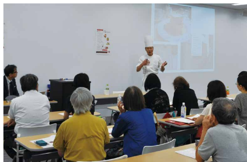
2015年7・8月 公開講座 「神戸スイーツの魅力語る」