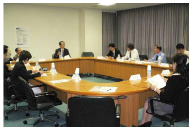
2013年9月 グローバルシンポジウム (甲南大学・台湾国立聯合大学)