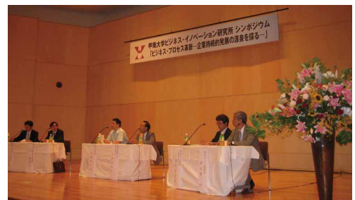
2006年7月 第3回シンポジウム

一方、2005年に第1回研究会「コミュニティ・ビジネスの現状と新たな展開」を開催して以来、「ITによる経営プロセス革新ーモバイル技術のビジネスへの応用ー」、「ビジネス戦略革新ー分析手法のビジネスデータへの適用ー」、「産業クラスターと地域活性化」、「東アジアにおけるニュービジネスへの挑戦」、「アジア・中国ビジネスの最新動向と