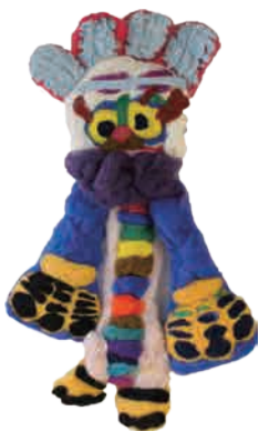
Makoot [マクート] 067