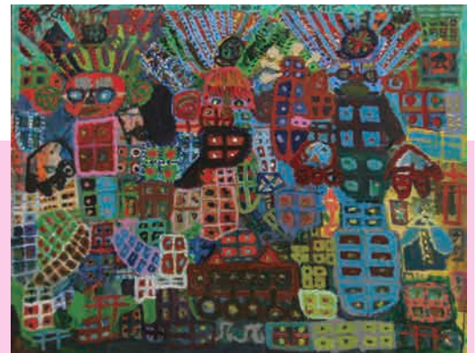
《アトリエ》2005年、727×117cm、アクリル・キャンバス