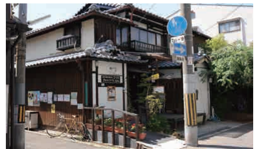
アトリエコーナス外観

1993年に障害者の母親達によってコーナス共同作業所として設立された後、「ひとり一人が自己を自由に表現するアート活動を始めたい。地域に開かれた場を作りたい」と2005年にリノベーションした町屋に移転。アートを中心に様々な活動を行う生活介護施設アトリエコーナスとして活動を開始。制約や制限を外し自由に生み出されたエネルギー溢れる作品は、国内外問わず評価を得ている。また施設は誰もが立ち寄れる日常的な交流の場として開かれ、地域に根ざした活動や多様なネットワークの構成にも努めている。