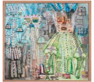
《ピン》制作年不詳 90×90cm アクリル、ピン・キャンバス