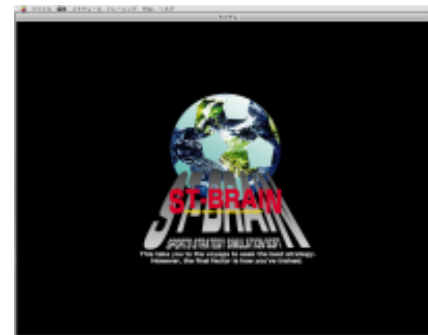
図1 ソフトの表紙画面

Jリーグ指導者、ソフト開発会社の協力を得、日常のトレーニング記録を簡単に作成し、管理するソフトを開発した。カレンダー機能を持たせることで簡単に過去のトレーニングや試合の記録などを省みることが可能であり、膨大な資料の整理が必要なトレーニング現場をサポートできた。Jリーグのあるチームは、このソフトをトレーニング現場にて有効活用し、好成績を収めた。