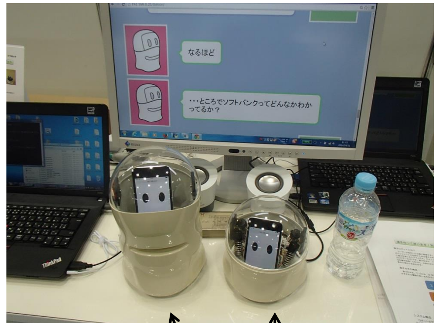
あいちゃん ゴン太