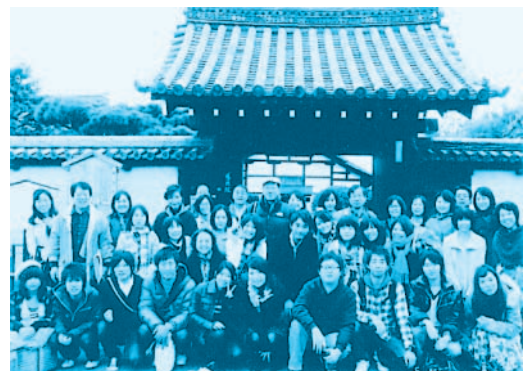
京都の慈昭院前にて

以上のように、盛り沢山の企画をしています。ぜひ、韓国語・韓国文化を学習して、活動する場を韓国、ひいては世界へ広げて行ってほしいと思います。