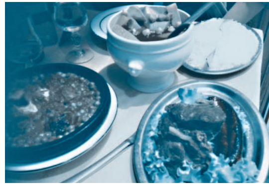
北アフリカ料理：タジン tajine(左) とクスクス couscous

アフリカ ：ガボン、カメルーン、コート・ジボワール、セネガル、ブルキナ・ファソなど