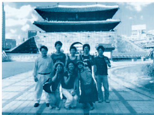
ソウルの南大門前にて

②夏休み（8月）には、約3週間の 夏期語学講座 （ソウルの漢陽大学校）を開設しています。