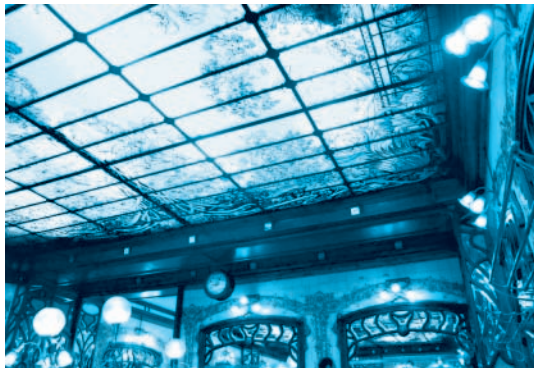
ベル・エポックの雰囲気のレストラン 1900