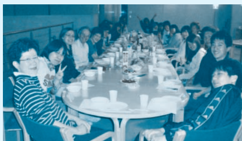
過去のフランス語強化合宿の写真より