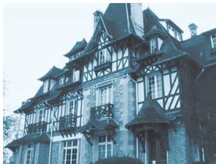
ランブイエの校舎

フランス語を学べば、 フランス語の運用能力が養成できるだけでなく、ヨーロッパや北米のフランス語圏の事情や文化についても学ぶことができ、グローバル化社会で活躍するための知識や考え方なども吸収できます。 そして、 フランス語を学習すれば、グローバル化社会に必要な英語の単語力補強にも役立つのです！