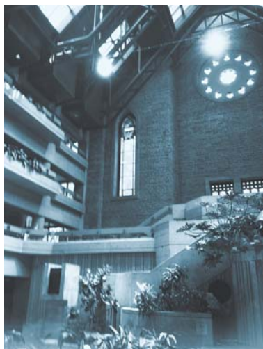
ケベック大学モントリオール校(UQAM)

左の写真は、カナダのケベック大学モントリオール校の構内から撮ったものです。州立ケベック大学と本学の提携の交渉が進んでおり、 2018年度からは、5月～8月上旬にケベック大学トロワ・リヴィエール校にて、キャンパス内の学生寮に住み、フランス語を集中的に学ぶ「奨励留学」 が可能となる予定です。