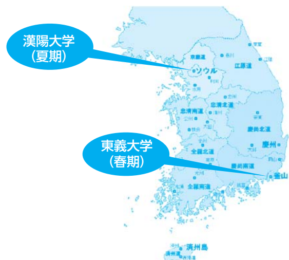
海外語学講座開催地（ソウル・釜山）

以上のように、盛り沢山の企画をしています。自分の実力を高めて下さい。現在、韓国で商取引・投資・物品の生産関係の仕事はもとより、芸能・スポーツ・音楽・和食関係などの様々な分野で活躍している日本人が多数います。ぜひ、韓国語・韓国文化を学習して、活動する場を韓国、ひいては世界へ広げて行ってほしいと思います。