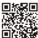
Cro - Traum

最後はおまけのドイツのポップ音楽。少しドイツ語のメロディーを聞いてみてください。ドイツ語が少しわかるようになれば、こんな曲を口ずさみながらドイツ語のフレーズを覚えるなんていうのもいいですね。