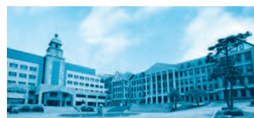
「漢陽大学の本館(新館:左・旧館:右)」