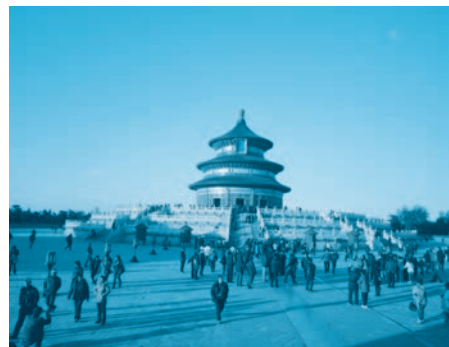
天壇公園祈年殿 (北京)

◎「どこへ行きたい?」「ディズニーランドに行きたい」という会話です。漢字の右のローマ字は、ピンイン(拼音)という中国語の発音表記です。ピンインは中国語の発音を表わす合理的でわかりやすいシステムなので、まずはピンインを通して中国語の発音を学びます。しかし中国語の文字はもちろん漢字であり、ピンインは学習のための補助手段です。ピンインを通して中国語の発音を学び、ピンインなしで漢字を直接読めるようになって下さい。一つの音節には四つの「声調(高低アクセント)」があります。そのアクセントは主となる母音の上にわかりやすい形(高く伸ばす一・急上昇/・低く抑える∨・急降下\ )で書いてあります。中国語はメロディーのある、音楽のような言語です。まるで歌を歌うように声調を駆使することが、中国語を話す楽しさのひとつだと言っていいでしょう。