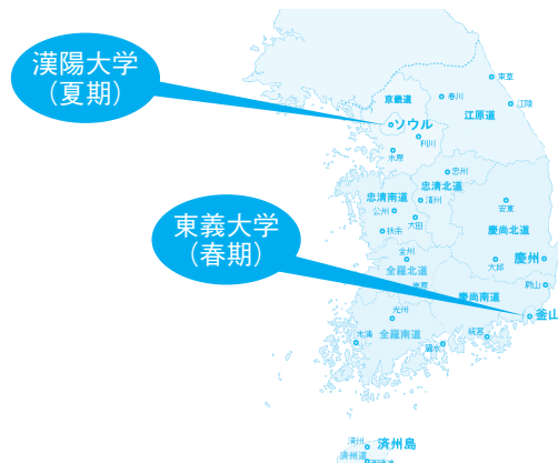
「海外語学講座開催地(ソウル・釜山)」

以上のように、受講生のため盛り沢山の企画をしています。これらの機会を利用してご自身の実力を高めて下さい。現在、韓国で多くの日本人が商取引・投資・物品の生産関係の仕事はもとより、芸能・スポーツ・音楽・和食関係などの様々な分野で活躍しています。ぜひ、韓国語・韓国文化を学習して、活動する場を韓国、ひいては世界へ広げていってほしいと思います。冷えてきている人々の移動は新型コロナウイルスが終息すると、直ちに再開されることでしょう。