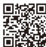
Annett Louisan - Besonders