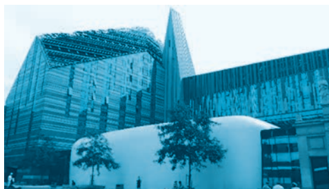
ライプツィヒ大学校舎

甲南大学は、専攻分野の学習だけではなく、国際的に通用する人材育成のために、多数の留学や語学研修プログラムを提供しています。ドイツ語を履修すると、 ライプツィヒやドレスデン といった、 長い歴史を持った素敵な街に行くチャンス があります。上のQRコードをスキャンすると、ライプツィヒ大学の学生の「ごく普通の日」が見られます。日本と比べると、景色や雰囲気、食べ物は違いますが、日本と同じように、皆さんと同じ年頃の人たちが、未来に向けて頑張っていたり、その日一日を楽しく過ごしたりしています。自分がこの街の一部になるかもしれない、と思いながら見てください。