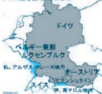
ドイツ語を話す国と地域

1年生の基礎が終わると、 2年生以降は中級ドイツ語やドイツ語圏文化に関する授業、3・4年生で上級ドイツ語 を履修すれば、ドイツ語能力をさらに伸ばすことができます。1年生で培ったコミュニケーション能力の基礎を広げ、深め、少し話せるようになったかな?と思ったら実際にドイツに行って旅行するもよし、 現地の語学講座や留学 にチャレンジしてみるもよし、学生時代にしかできないいろいろな道が開けてきます。