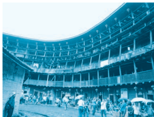
福建省の客家土楼

●漢字という共通点は確かにメリットです。しかしそのメリットに安住せず、日本語と異なる字体の漢字も書いて覚えましょう。日本語を話す私たちにとって、中国語は親しみやすい外国語ですが、決して簡単とはいえません。中国語はどのような原理で組み立てられるのかということをしっかり把握して下さい。英語を学んだ経験を生かして、日本語との類似点と相違点を意識しながら、中国語に取り組んでほしいと思います。一回生で学ぶ「基礎中国語」の授業で「使える中国語」の足場をしっかりと固め、「中級中国語」「上級中国語」と継続して学習することが大切です。