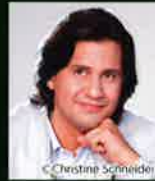
クラウディオ・ポルクス(Vc)