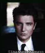
アレッシオ・パグニス(Pf)