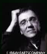
エリック・ル・サージュ(Pf)