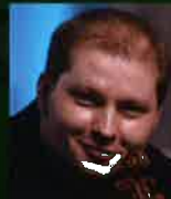
ボリス・プロコフイフ(Vn)