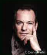
エマニュエル・パユ(FI)