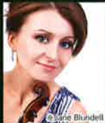
ナタリア・ロメイコ(Vn)