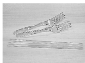
CAFBL0™ で作られた フォークとストロー