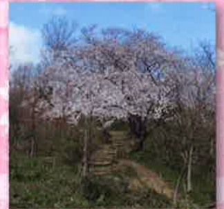
金鳥山に向う登山道沿いのサクラ