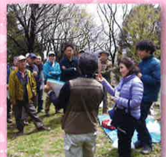
判り易くて楽しい樹木教室