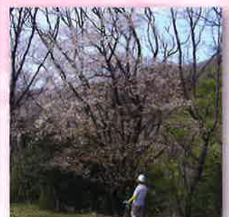
満開のヤマザクラ

「この地図は、国土地理院長の承認を得て、同院発行の数値地図 25000(地図画像)を複製したものである。(承認番号 平 29 情複、第 1439 号)」「承認を得て作成した複製品を第三者がさらに複製する場合には、国土地理院の長の承認を得なければならない。」