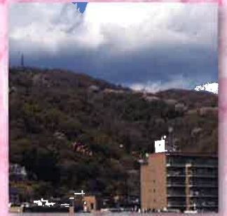
岡本から望む保久良神社付近の桜回廊