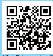
(兵庫県ホームページ)

兵庫県 産業労働部 新産業課 電話：078-362-4157 (平日 午前9時～午後5時30分まで) メールアドレス：Shinsangyo@pref.hyogo.lg.jp URL：https://web.pref.hyogo.lg.jp/sr10/startupkoshien.html