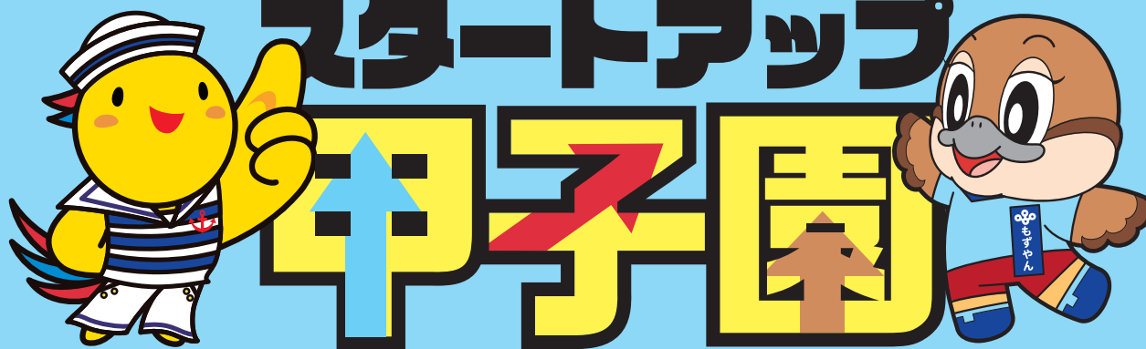
兵庫県マスコットはばタン