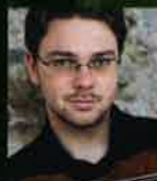
アレクサンダー・ショコフツェフ(Vn)