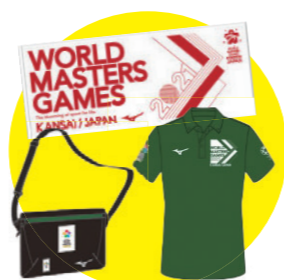
[ボランティアキット（例）]