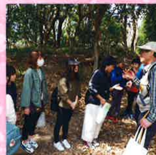
楽しい自然観察会