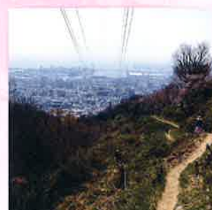
薬大尾根からの眺望

「この地図は、国土地理院長の承認を得て、同院発行の数値地図 25000 (地図画像) を複製したものである。(承認番号 令元情複、第 936 号)」「承認を得て作成した複製品を第三者がさらに複製する場合には、国土地理院の長の承認を得なければならない。」