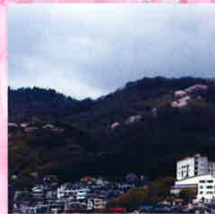
本山南町から望む岡本桜回廊