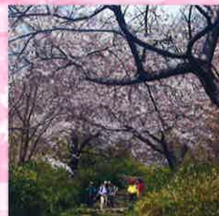
金鳥山付近の桜のトンネル