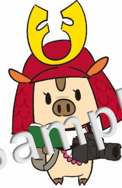
㉒フィールドワーク ㉓プログラミング