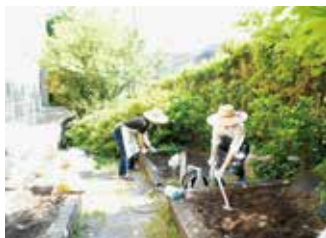
春のガーデニング