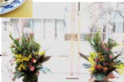
クリスマス アレンジメント