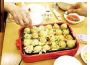
学祭企画 たこ焼き パーティー