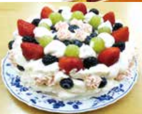
クリスマスケーキでパーティー