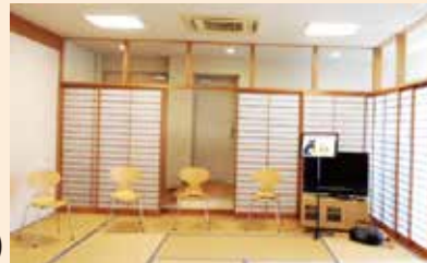
グループワーク室