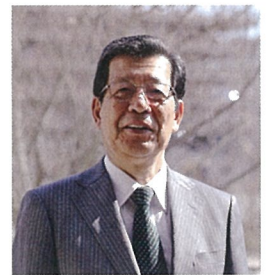
兵庫県立人と自然の博物館館長

1957年大阪生まれ。大倉流十五世宗家・大倉長十郎氏の次男として生まれる。1964年、独鼓「鮎之段」にて初舞台。1985年、能楽小鼓方大倉流十六世宗家を継承(同時に大鼓方大倉流宗家預かり)。公益社団法人能楽協会理事。一般社団法人東京能楽囃子科協議会理事。一般社団法人日本能楽界会員。2017年10月、能楽囃子方小鼓方として重要無形文化財(人間国宝)に認定される。「大倉源次郎の能楽談義」を上梓するなど、能楽の原点や魅力を伝える活動も精力的に行っている。