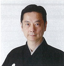
能楽小鼓方大倉流十六世宗家・人間国宝