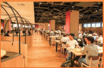
2022(令和4)年 Hirao Dining Hall (画像はコロナ禍以前のもの)