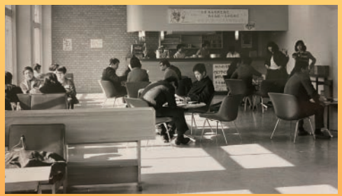
1970(昭和45)年 カフェパンセ

この時代ランチ(定食)が100円。カレーなどの単品メニューは50円から食べられました。