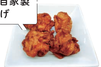
みんな大好き 甲南自家製唐揚げ

2019年の年間販売数は約26,000食を記録。しょうがをたっぷりきかせたしょうゆ味で見た目の色も濃い目に仕上がっています。マヨネーズをつけたり、七味をつけたりと味変する方も多数。現在、個数は5個から4個になり、価格も下がって提供されています。