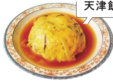
不動の人気天津飯

2019年の年間販売数は約27,000食を記録。レギュラーメニューとして登場したのは1985年12月で、「手軽に食べられてボリュームもある安価などんぶりもの」として生まれました。サイズはS・M・Lの展開がありましたが、現在は混雑緩和のためにMサイズのみの販売となっています。