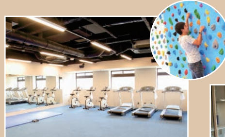
フィットネスルーム