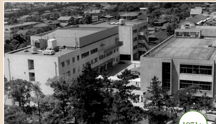
学生会館・学生会館

甲南学園創立100周年記念事業のひとつとして、2017年、岡本キャンパスに誕生したiCommons。食堂をはじめ、フィットネス施設やキッチン、クラブの部室などのほか、学生部、キャリアセンターといった学生が日常で活用する機能を集結した複合施設です。それまで、学生会館と学生会館の2棟に分かれていた機能をひとつにし、さらにバージョンアップした施設で、アクティブな時間を生み出す学生の集いの場になっています。