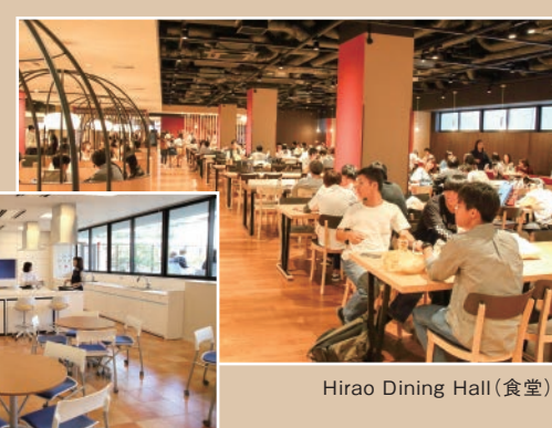
Hirao Dining Hall(食堂)

甲南学園創立100周年記念事業のひとつとして、2017年、岡本キャンパスに誕生したiCommons。食堂をはじめ、フィットネス施設やキッチン、クラブの部室などのほか、学生部、キャリアセンターといった学生が日常で活用する機能を集結した複合施設です。それまで、学生会館と学生会館の2棟に分かれていた機能をひとつにし、さらにバージョンアップした施設で、アクティブな時間を生み出す学生の集いの場になっています。