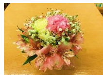
クリスマス・ アレンジメント