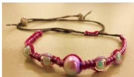
ミサンガを作ろう