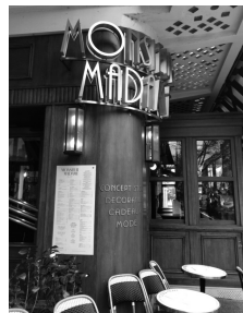
法律に従って価格を明示したメニューが 入口に掲示されている

フランス語を学べば、フランス語の運用能力が養成できるだけでなく、 ヨーロッパや北米のフランス語圏の事情や文化についても学ぶことができ、国際交流を通じてフランス語圏に友人をつくる ことができます。また、 フランス語の学習は、グローバル化社会に必要な英語の単語力補強にも役立つのです！