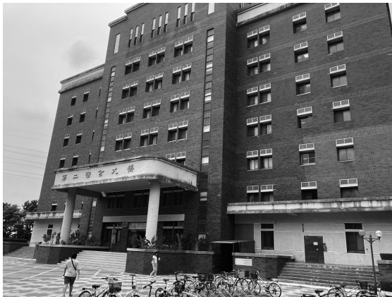
長栄大学（台南）の学生宿舎