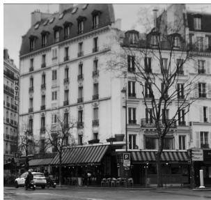
凱旋門近くのテルヌ広場の おしゃれなカフェレストラン