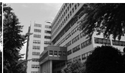
「海外語学講座開催地（ソウル・釜山）」 「漢陽大学 中央図書館（白南学術情報館）」