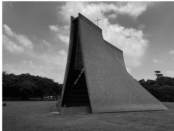
台中の東海（トンハイ）大学キャンパス内の教会