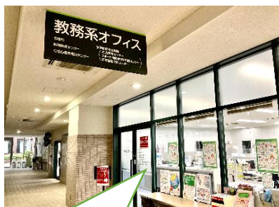
3号館 1F 教職教育センター事務室

教務系オフィスの中央（出口専用扉付近）に教職教育センター事務室があります。カウンターで職員にお声がけください。