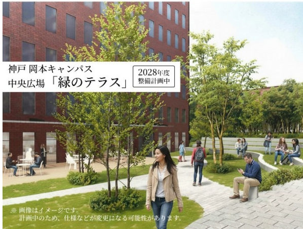
【岡本キャンパス 中央広場 「緑のテラス」完成イメージ】