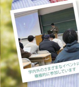
学内外のさまざまなイベントに積極的に参加しています