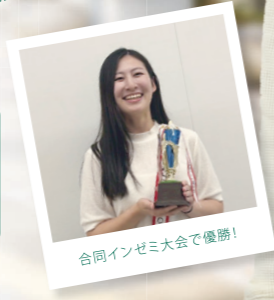
合同インゼミ大会で優勝!

さまざまな経済現象や問題を、経済学の理論やデータを用いて科学的に分析。統計学やプログラミングについても、実践的に学びます。