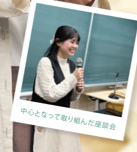
中心となって取り組んだ座談会