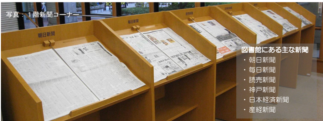
写真：1階新聞コーナー